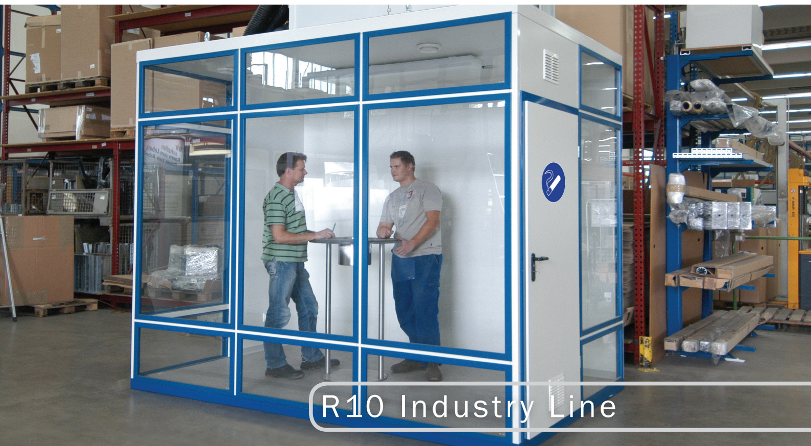
R10 Industry Line

Die ideale Lösung für Produktions- und Lagerbereiche. Durch die komplett geschlossene Raucherkabine werden auch mögliche Brandrisiken durch weggeworfene Zigarettenkippen ausgeschlossen. BGIA-zertifiziert für 10 Raucher. Ein Hochleistungsfilter mit großer Kapazität garantiert eine lange Filterstandzeit und minimiert dadurch die Folgekosten. R10 INDUSTRY LINE kann mithilfe eines Staplers versetzt werden und ist dadurch äußerst flexibel. Es genügt ein normaler 230 Volt Stromanschluss. Aufwendige Lüftungsanschlüsse sind nicht notwendig. Optional mit Rauchertisch Smoke Table DESIGN LINE lieferbar.